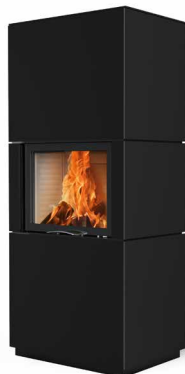
Colin 65 Stahl