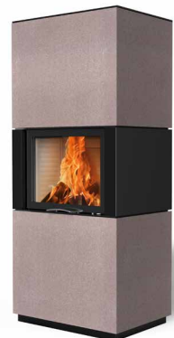
Colin 65 Beton terra