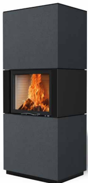
Colin 65 Beton anthrazit