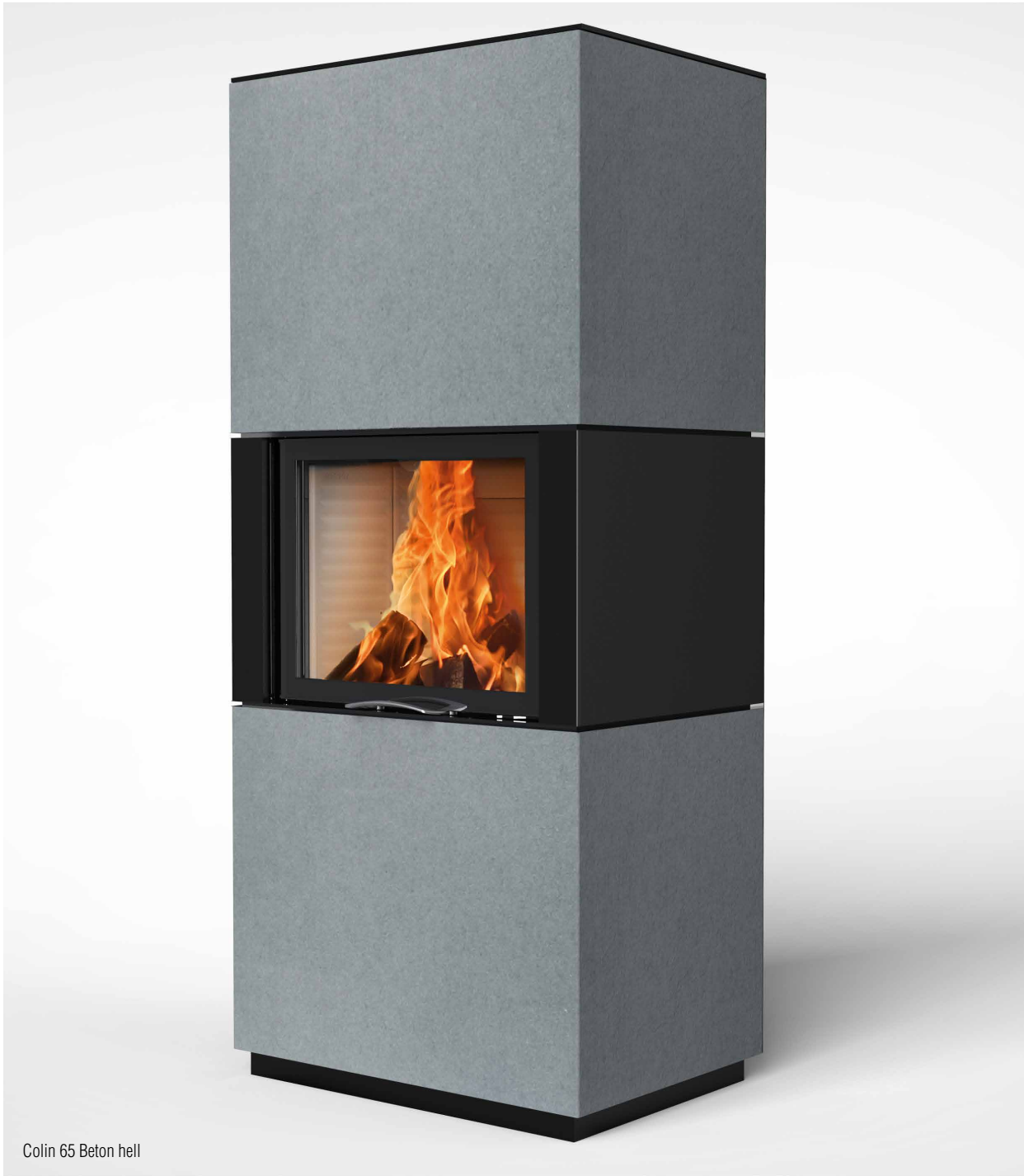
Colin 65 Beton hell